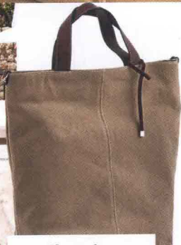
Shopping Marina Rinaldi.