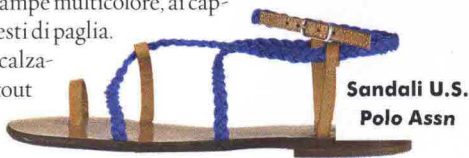
Sandali U.S. Polo Assn

A CACCIA DI ISPIRAZIONI HIPPIE nella più movimentata delle isole greche. Il San Giorgio Mykonos ( sangiorgio-mykonoshotel.com ), della catena Design Hotels, accoglie gli hipster di mezzo mondo con la sua atmosfera folk e rilassata. Dress code: bohémienne e casual. Via libera quindi ai parei dalle stampe multicolore, ai cappelli a falda larga e ai cesti di paglia. Immancabili i classici calzari di cuoio, passe-partout perfetti da indossare di giorno e di sera.