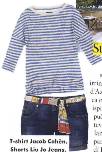
T-shirt Jacob Cohën. Shorts Liu Jo Jeans.

TRA PIC-NIC E PASSEGGIATE a cavallo sulla spiaggia, escursioni in barca, la bella stagione è "into the wild". Le case in pietra di Domaine de Murtoli, ( equinoxe.it ) accolgono gli ospiti con soggiorni esclusivi a tu per tu con la natura. La valigia perfetta? Mixa influenze Eigthies e tocchi gipsy. In nome di un mood esotico e contemporaneo, come quello della modella brasiliana Alessandra Ambrosio (a sinistra).