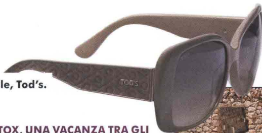
Occhiali da sole, Tod's.