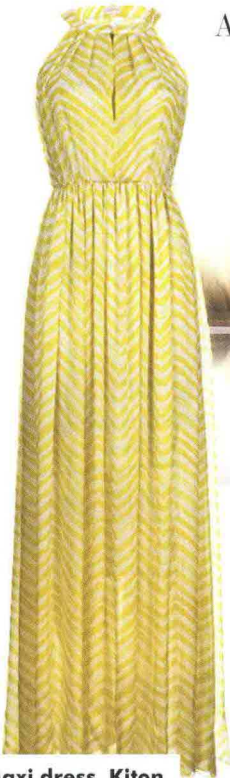
Maxi dress, Kiton.

Abiti leggeri, occhiali da diva, stampe e ricami. Coast to coast, come vestirsi quest'estate. E dove alloggiare. Con la massima eleganza